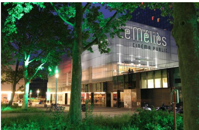
Le Méliès (Montreuil - 93)